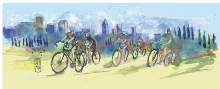
Certaldo Alto, ciclisti