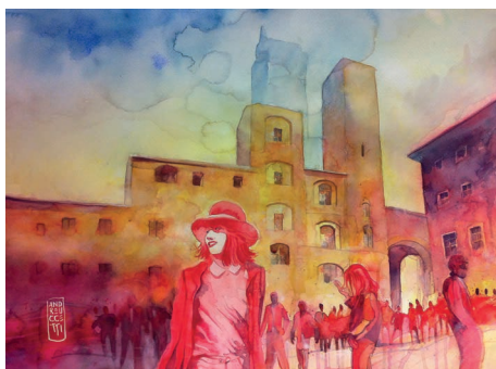
Piazza della Cisterna, San Gimignano