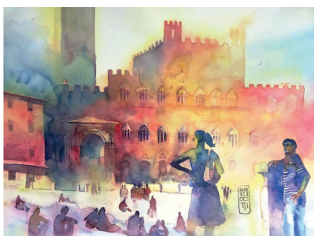
Piazza del Campo, Siena