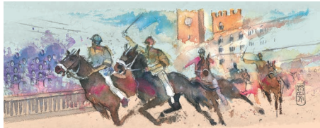
Il Palio di Siena