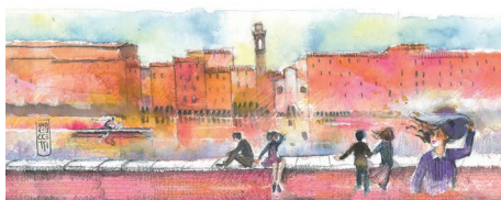
Lungarno Firenze, turisti