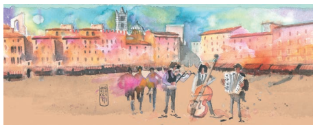
Piazza del Campo, Siena, musicisti