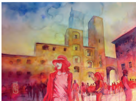
Piazza della Cisterna, San Gimignano

Cod. Articolo 1499 ANTIPASTO TOSCANO Latta rettangolare 18x24x8h cm salamino toscano taglierino in legno pancetta stagionata salsa crostino toscano con "Cinta Senese DOP" focaccine al naturale