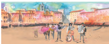
Piazza del Campo, Siena, musicisti

Cod. Articolo 1498 SALAMINO TOSCANO Latta cilindrica Ø 8,8x16h cm salamino toscano taglierino in legno