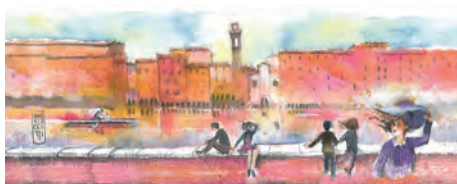
Lungarno Firenze, turisti