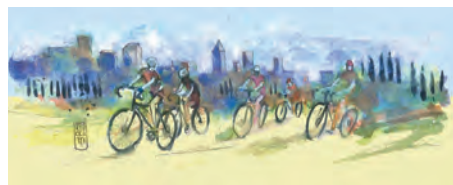
Certaldo Alto, ciclisti