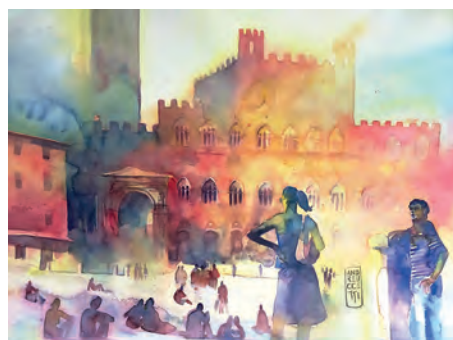
Piazza del Campo, Siena