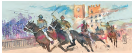
Il Palio di Siena